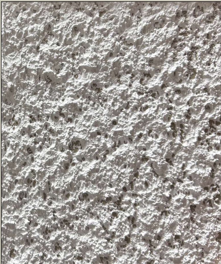
スタッコ吹放し玉模様