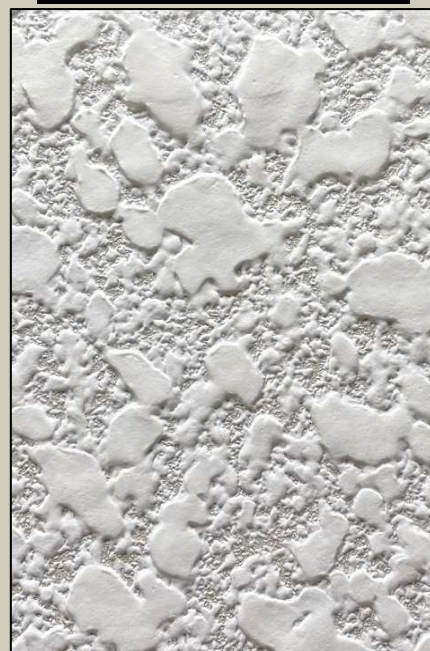
H2-7(ヘッドカット模様)