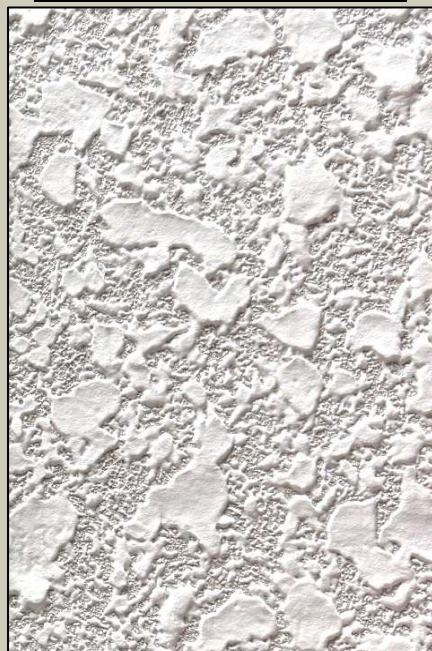
H1-7(ヘッドカット模様)