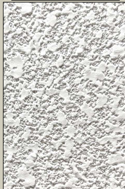
H3-7(ヘッドカット模様)